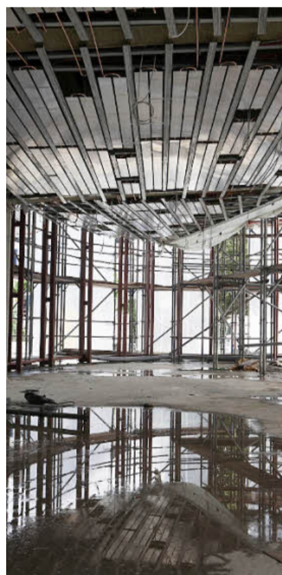
In einer Regenlache spiegelt sich der Erweiterungsbau des Foyers.