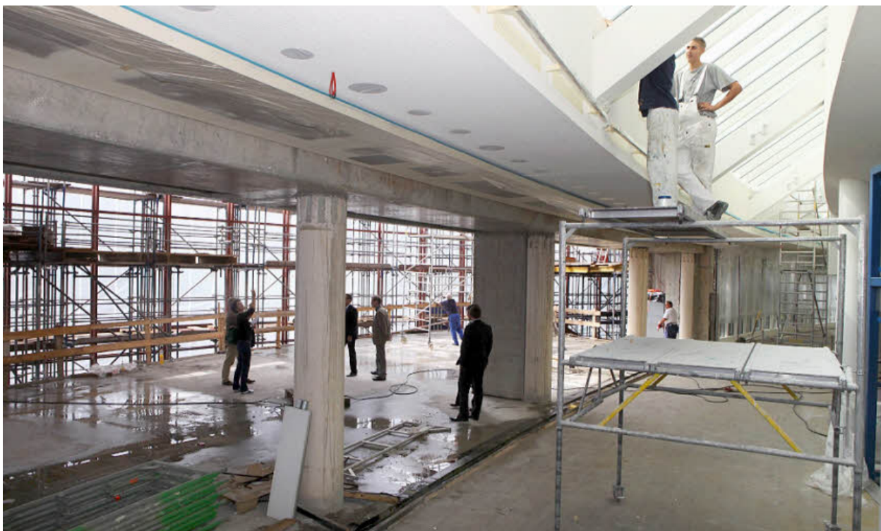
Die Stützen markieren die Fläche des alten Foyers, davor wächst aus Stahl und Glas die Erweiterung.