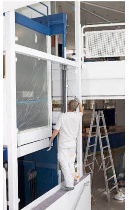
Bis zu 60 Arbeiter legen Hand an ...