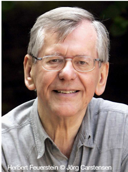
Herbert Feuerstein

Vor den Konzerten am 28. und 29. Januar 2011 gibt es jeweils eine Einführung mit Frank Strobel und Ulrich Wünschel um 19.15 Uhr im Joseph-Keilberth-Saal.