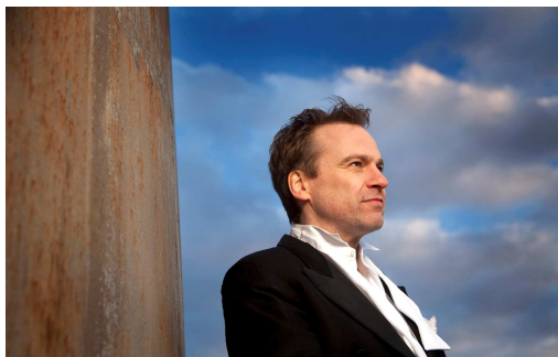
Jonathan Nott