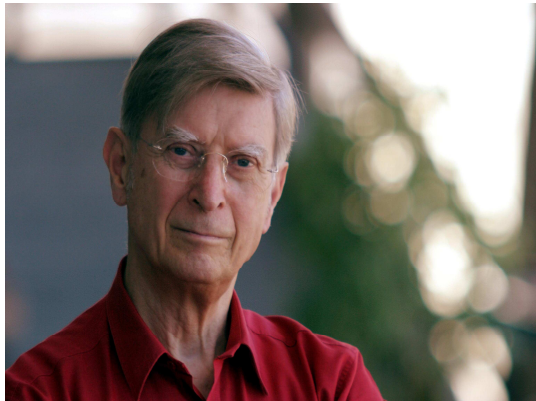
Herbert Blomstedt